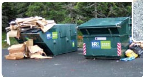
Her var det god plass i containerne, men avfallet lå utenfor.

Alt avfall som plasseres utenfor containerne må håndteres manuelt og eventuelt hentes med egnet lastebil. Dette fordyrer renovasjonsordningen, og det er hytteeierne som må betale dette i form av økte gebyrer. I tillegg medfører feil sortering en kostnadsøkning. Det oppfordres til kun å kaste treverk/metall i de containerne som er beregnet for dette – ikke RESTAVFALL OG LIGNENDE. Kastes det impregnert treverk – som defineres som farlig avfall – i containeren for treverk medfører dette en ekstra kostnad. Farlig avfall (maling, beis, batterier) MÅ leveres til godkjent mottak (for eksempel betjente gj.stasjoner – leveres GRATIS) og ikke hensettes på Benstigen. Dette er avfall som skal behandles videre og krever deklarasjon osv.