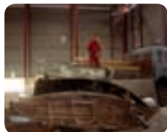
Endestasjonen på Roverudmyra 27.mai

Den mange ganger omtalte oppryddingsaksjonen er nå slutført. Det var meningen at alt skulle trekkes opp i fjor høst (se innlegg i Bb nr. 89), men snøforholdene ble for vanskelige. Det så ut over våren ut til at vi måtte gi opp prosjektet denne vinteren, men som de fleste nok har merket seg er at snøen har vært veldig sterk i vinter (store såkalte kohesjonskrefter), 13. mai trakk vi opp 6 vrak, 21. mai gikk resten. Det var mulig å gå på beina til langt ut på dagen begge dager! Forholdene var ikke akkurat de letteste, det sto 20 cm vann i myra til langt inn på land. Det ble også mye graving for å få med seg alt.