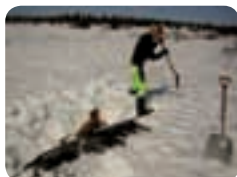
Terje Kristiansen i sving med spaden